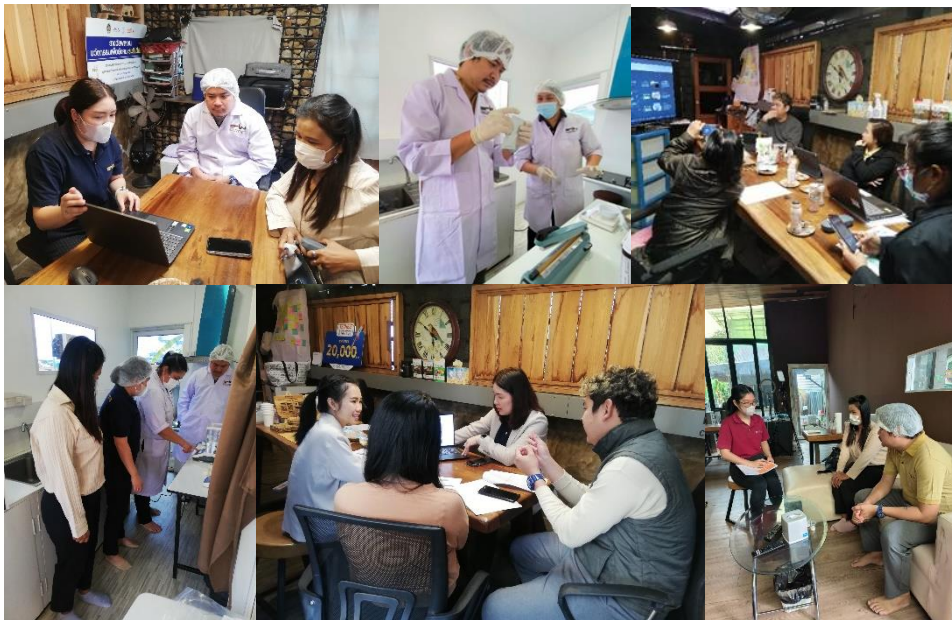
ภาพการดำเนินงาน