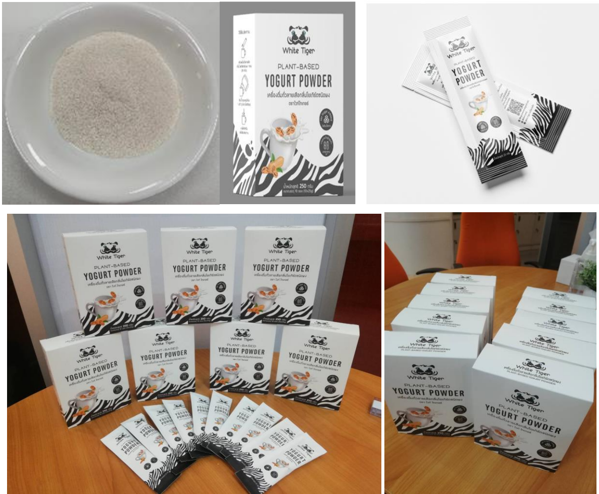
ภาพตัวอย่างผลิตภัณฑ์ที่พัฒนาในโครงการ

ลิงค์สนับสนุนโครงการ https://www.facebook.com/profile.php?id=100081528432381&locale=hu_HU